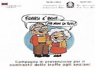
Conferenze 14 Settembre