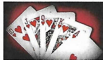
Gioco di Burraco Giovedì 02 settembre Attività di Club