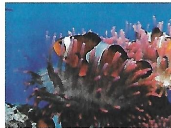
ACQUARIO DI GENOVA o MOSTRA DI ESCHER 8-10 OTT.