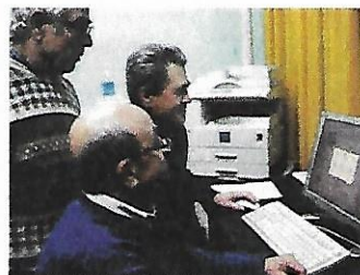
Corso Computer per tutti