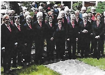
Settembre riprendono le prove Della Corale Anteas